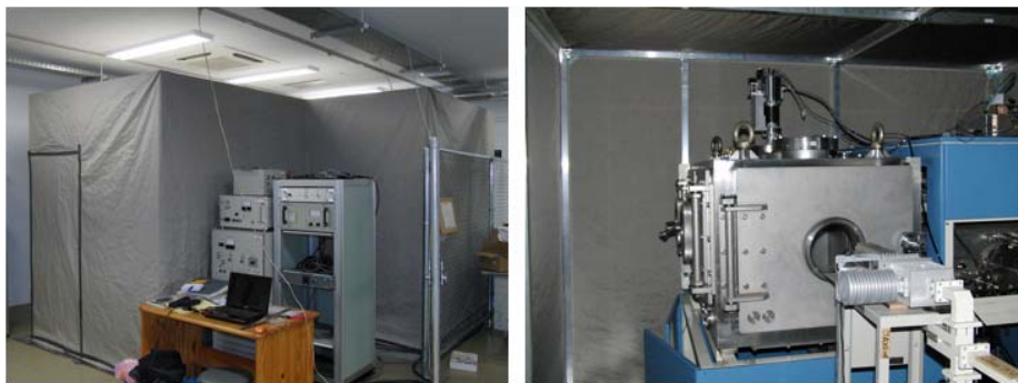
図3 2010年度からのマイクロ波照射実験の実験装置